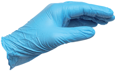
Αδιάβροχο γάντι μίας χρήσης από νιτρίλιο