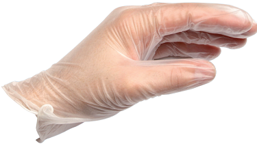
Αδιάβροχο γάντι μίας χρήσης από βινύλιο