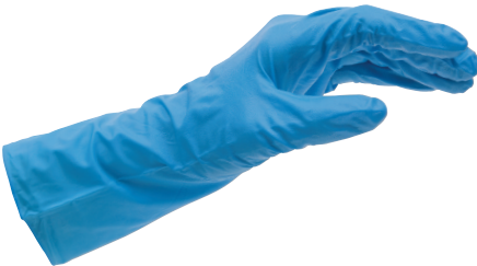
Γάντια προστασίας από χημικές ουσίες, κατά EN 374